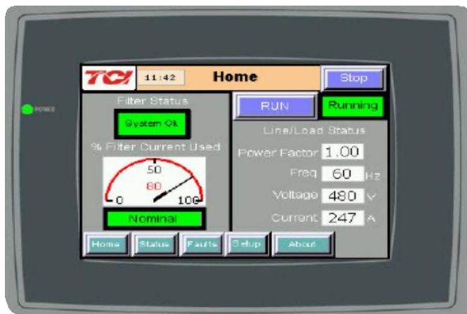
Grand IHM 65K Couleur

Le filtre est muni d'un grand écran tactile intégré IHM de 65k couleur avec éclairage 'backlight' DEL, et des options de communications tel que Modbus RTU sur RS485, Modbus TCP/IP, EtherNet/IP, DeviceNet et HGA-IHM.